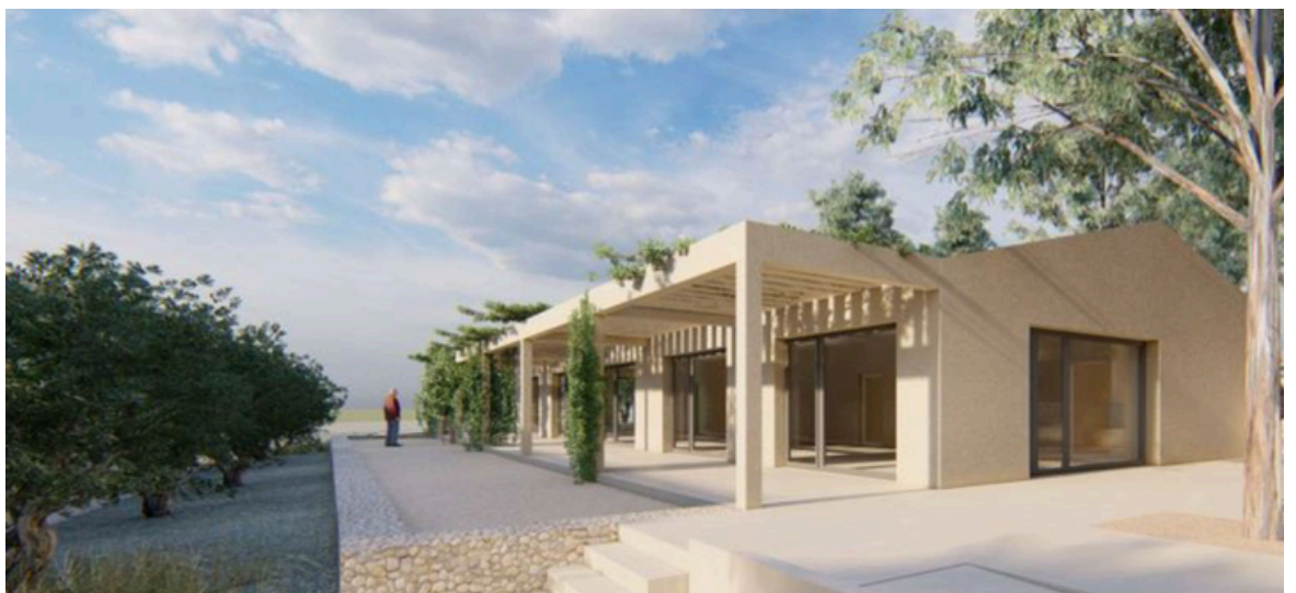
La salle commune

Une équipe dédiée au sein du CCAS aura en charge de mettre en adéquation les demandes et les critères d'attributions des logements.