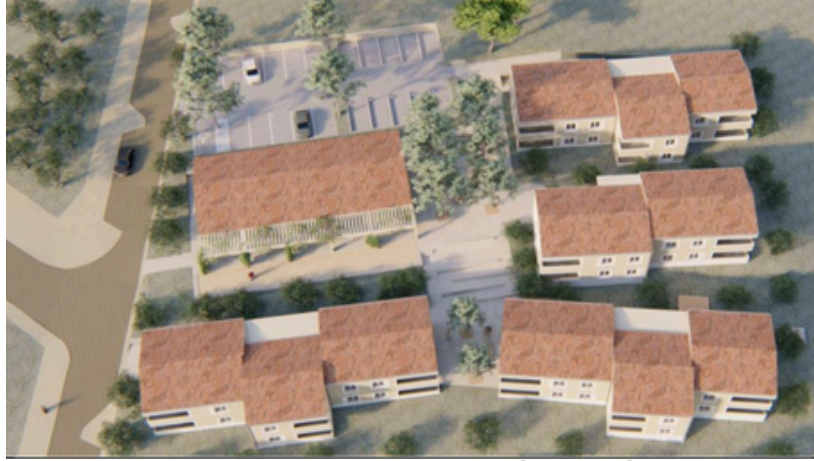
les 22 logements

Cette année 2026 va être l'année de démarrage de la construction des logements et de la salle commune du clos du vallon. 22 logements dont 12 T2 et 10 T3 ainsi qu'une salle commune de 200 m 2